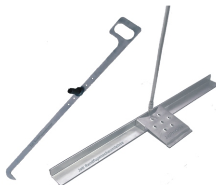
JATI RandfugenRäumer und JATI RandfugenSchaumleiste