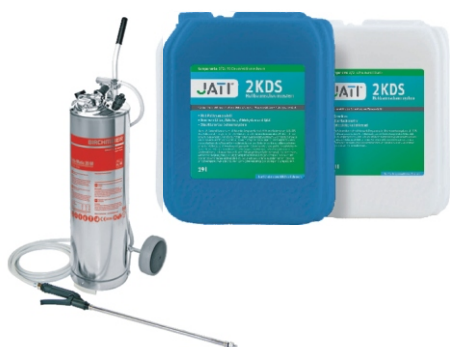
JATI 2KDS Hohlraumschaumsystem und Indu-Matic 20 M Schaumgerät

Staubbelastungen, Schmutz, organisches Material, Flusen, Schimmelpilze, Bakterien, Milben und selbst noch Rückstände aus der Zeit des Fußbodenaufbaus tragen zu einer hohen Belastung bei. Ein Absaugen mit Flusenbürste bringt zumeist nicht die erforderliche Beseitigung von Schmutz und Staubpartikeln. Zudem kann jahrelanges Einbringen von Feuchtigkeit durch Wischwasser in den Randfugenbereich möglicherweise Schimmelwachstum begünstigt haben.