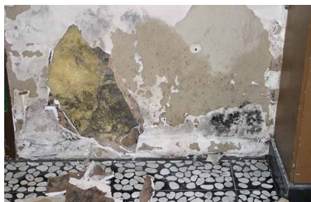
Gefahr durch Stachybotrys ch. auf Gipskarton