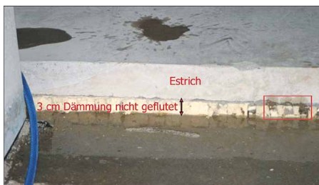
Wo keine Wirkstofflösung hingelangt, können auch keine Keime abgetötet werden