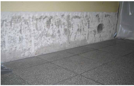
Putz abschlagen ist in vielen Fällen nicht notwendig

Dachbodenbereich, das eventuell durch Schimmelpilz oder hohe Sporenkonzentrationen kontaminiert ist, muss der Rückbau des Dämmmaterials geprüft werden. Zu bedenken ist, dass diese Sporen auch ein positives Sanierungsergebnis im Rahmen einer Freimessung beeinträchtigen können, weil sie durch Luftbewegungen aus dem Dämmmaterial in die Raumluft gelangen. Auch eine Feinreinigung ist unerlässlich.