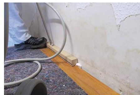
Desinfektionsschaum kann über die Randfugen in die Dämmung gedrückt werden.

Häufig resultieren Argumente von Desinfektionsgegnern aus Unsicherheiten im Zusammenhang mit Fehldeutungen von UBA-Leitfäden. Das geht hin bis zu der unrichtigen Behauptung, das UBA habe mit seiner Pressemitteilung vom Mai 2009 den Einsatz von Desinfektionsmitteln verbo-