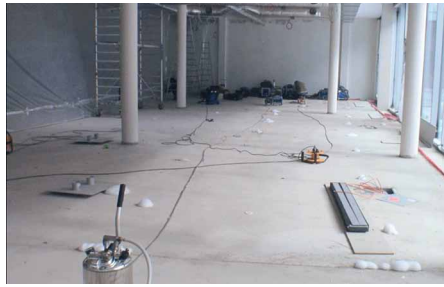
Desinfektion – besonders bei Gewerbegroßsanierungen die kostengünstige Alternative

Dass das UBA bei seinen Aussagen bezüglich abgetöteter Schimmelpilze bewusst davon spricht, dass eine allergene oder toxische Wirkung vorhanden sein kann, hat natürlich seine Gründe. Eine eindeutige und generelle Aussage hierzu kann keinesfalls getroffen werden. In