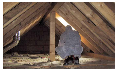
Schimmelpilz befallene Dachstühle müssen im Regelfall nicht abgerissen werden