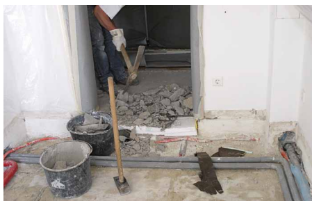
Rückbau von Estrich ist oft nicht erforderlich

Es gibt eine Reihe von Baustoffen, die nach Feuchteschäden und nachfolgendem Schimmelpilzbefall grundsätzlich entfernt werden sollten. Dazu gehören u. a. Tapeten und Gipskarton. Fast jeder mit der Schimmelpilzthematik Vertraute kennt beispielsweise die Situation nach Wasserschäden, bei denen ausgebaute Gipskartonplatten auch auf der Rückseite schwarzen Schimmelpilzbefall aufweisen. Der Versuch, den Befall auf der sichtbaren Vorderseite abzutöten, ist keinesfalls ausreichend. Da auf feuchtem Gipskarton häufig auch Stachybotrys ch. zu finden ist, sollte hier besondere Vorsicht gelten. Auch maroder, mit Schimmelpilzen befallener Putz sollte nicht in einem Gebäude verbleiben.