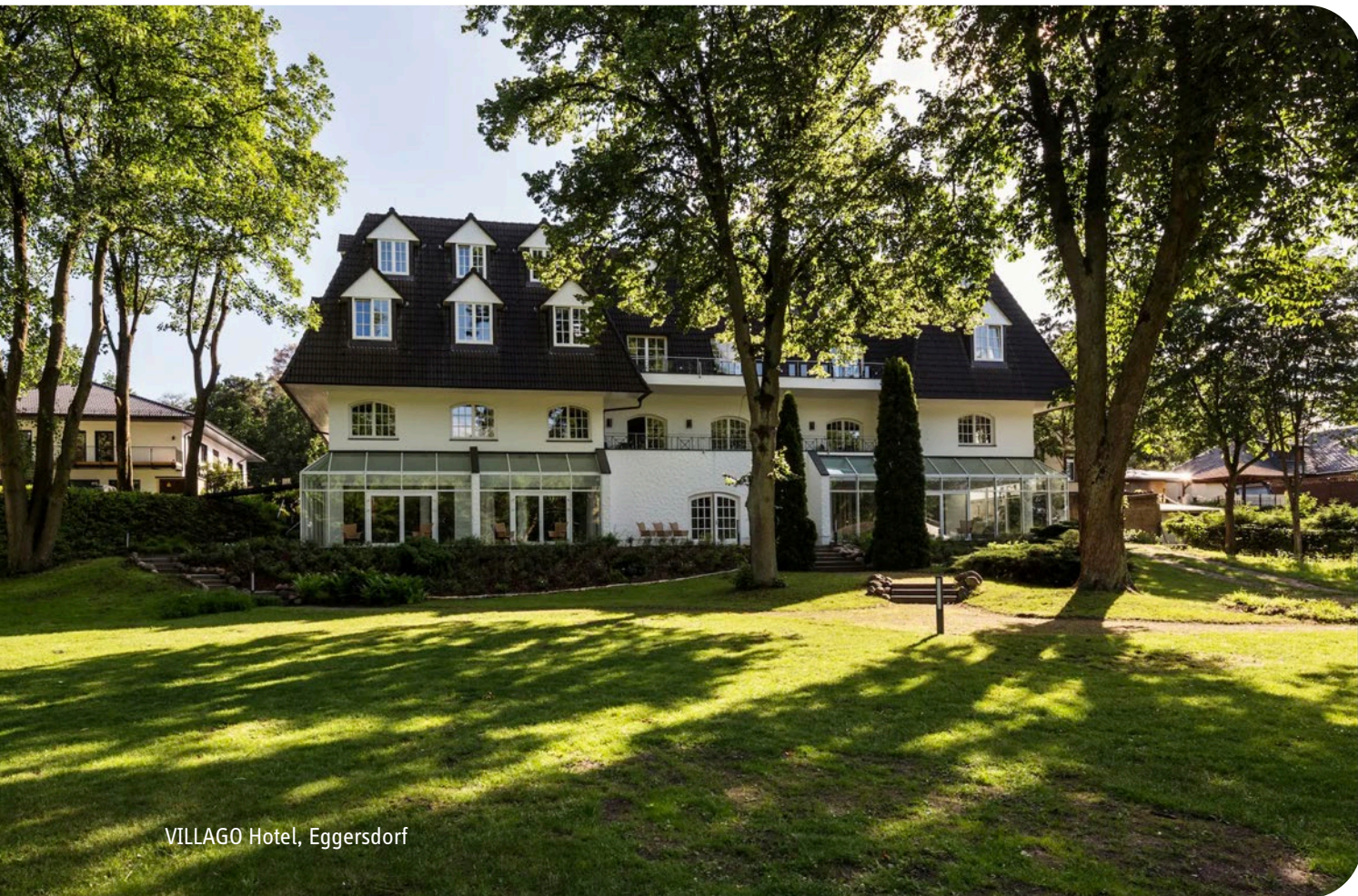
VILLAGO Hotel, Eggersdorf